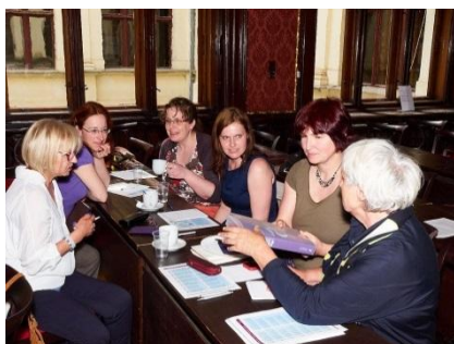
Workshop: Teaching Information and Digital Literacies

zorganizowane we współpracy z Biblioteką Czeskiej Akademii Nauk, Muzeum Narodowym Czech oraz Narodową Biblioteką Techniczną. Pierwszy związany był z zagadnieniami kształcenia kompetencji informacyjnych użytkowników w bibliotekach akademickich – praktyczne aspekty w zakresie metod nauczania i tworzenia treści cyfrowych. Warsztat drugi dotyczył kluczowych aspektów zachowania i zabezpieczania dokumentów audiowizualnych w dłuższej perspektywie.